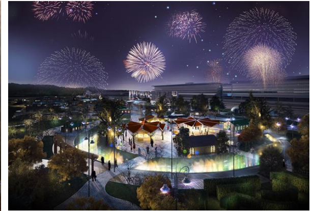
THEME PARK PLANNING & GATE DESIGN